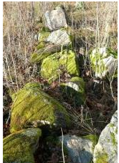
2. Kievarinmäen kiviaita