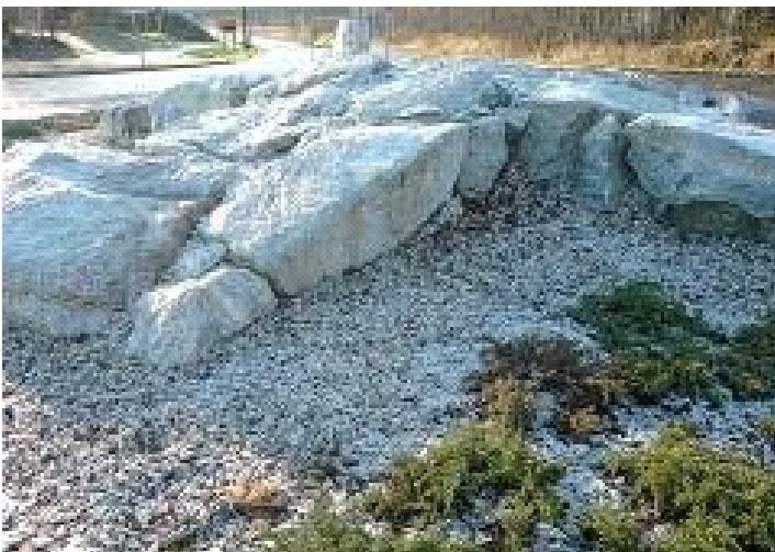
3. Kivet keskiössä