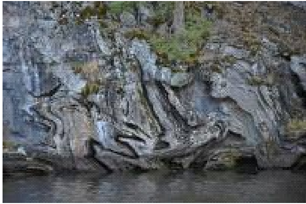
Kunniamaininta, Ämmän uunin urat