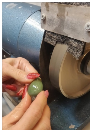
Siitä se hahmottuu