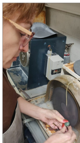
Vielä pientä tarkkuutta