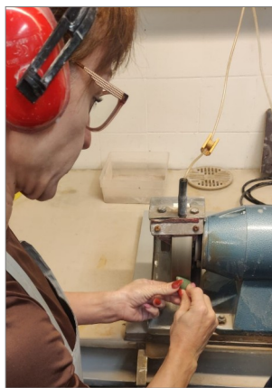
Tarkkana saa olla