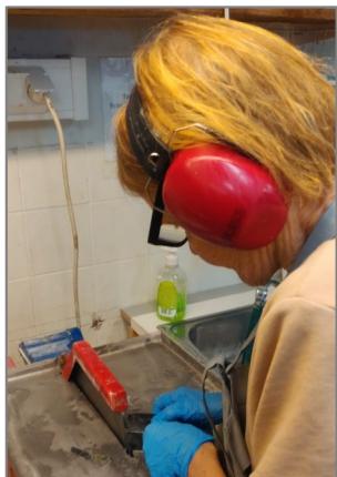
Sahauksesta se alkaa

Mutta toivottavasti hiontakipinä tuottaa lisää uusia löytöjä sen oudon löydön sisältä.